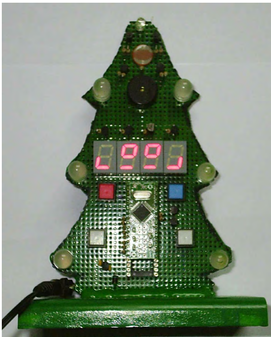
Abbildung A.1: MusicTree im Betrieb.