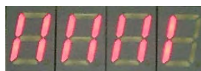
Abbildung 2.3: Helligkeit als Balken.