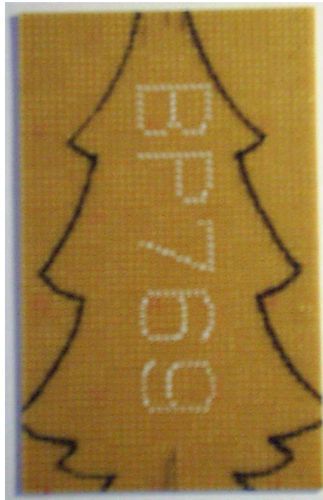
Abbildung 2.1: Lochrasterplatine mit Muster.

Drähten nicht besonders schön aussieht und die Kontakte von außen zugänglich sind, habe ich danach die Rückseite mit einer Heißklebepistole versiegelt. Wenn der Kleber getrocknet ist, kann dann die Rückseite lackiert werden. Der einzige Nachteil dieser Methode ist, dass man die Leiterbahnen nicht nachträglich verändern kann. Also muss man erst ganz sicher gehen, dass die Schaltung funktioniert, bevor man die Drähte unwiderruflich versiegelt.