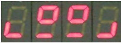
Abbildung 2.4: Animation „Smile“.