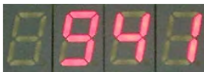
Abbildung 2.2: Helligkeit als Wert.

Mit dem Fotowiderstand kann die Helligkeit im Raum gemessen werden. Der Wert wird mit einem AD/Wandler des R8C/13 Mikrocontrollers gemessen. Dabei wurde der Wertebereich auf 0-1024 beschränkt. Die Null steht für ganz „dunkel“ und die 1024 für ganz „hell“. In dem Helligkeitsmodus wird der Wert entweder als eine Dezimalzahl oder als ein Balken ausgegeben. Mit diesem Sensor wird es erst möglich, dass z. B. die LEDs erst in der Dämmerung blinken.