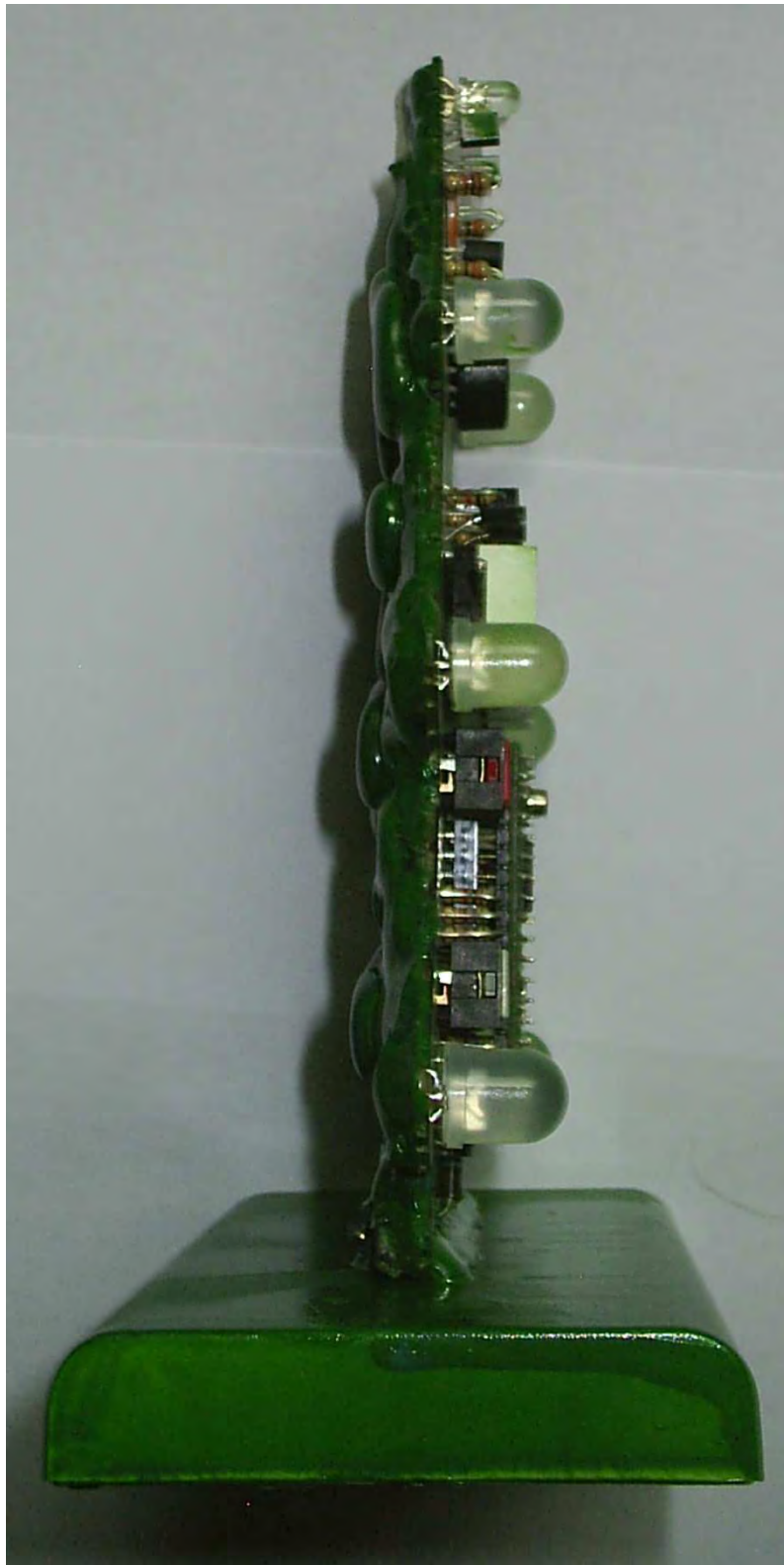
Abbildung A.3: MusicTree von der Seite.