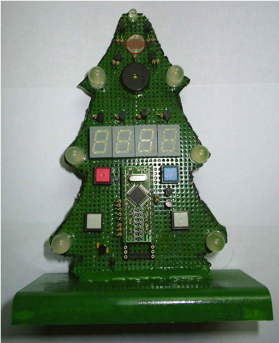
Abbildung A.2: MusicTree von vorne.