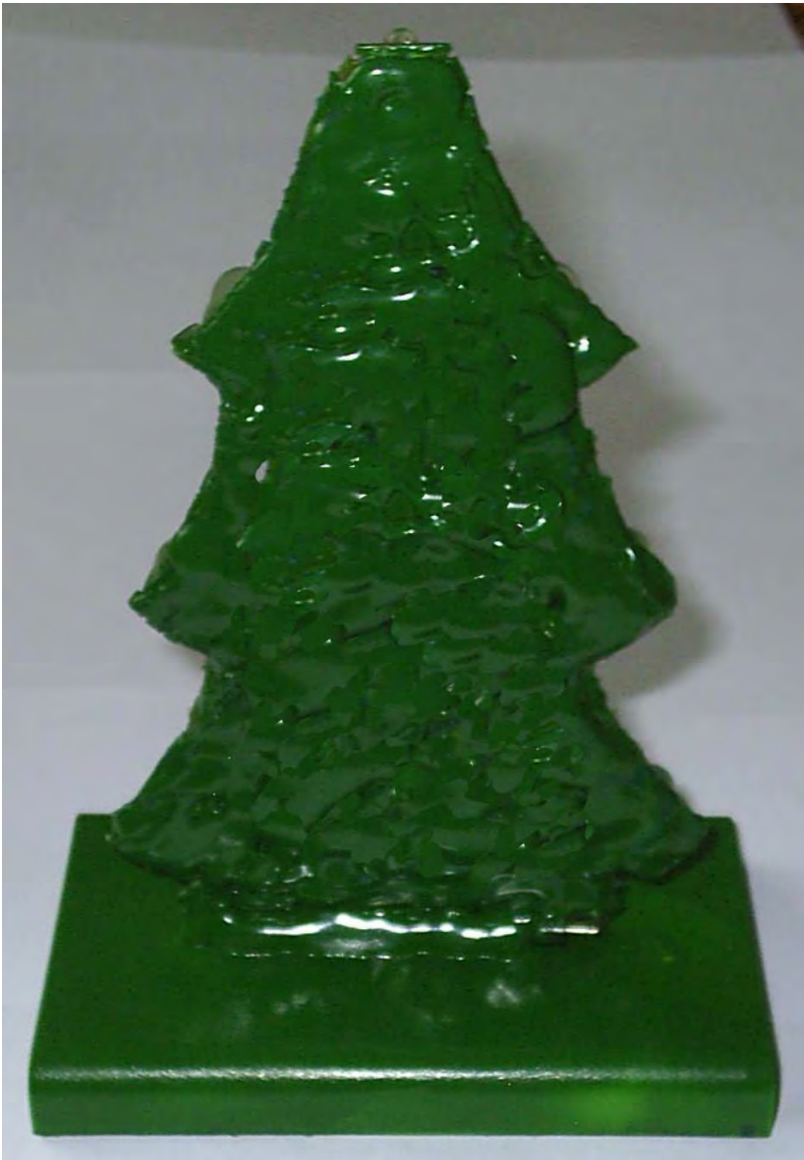
Abbildung A.4: Rückseite MusicTree.