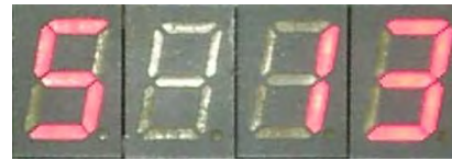
Abbildung 2.5: Nummer der Melodie.